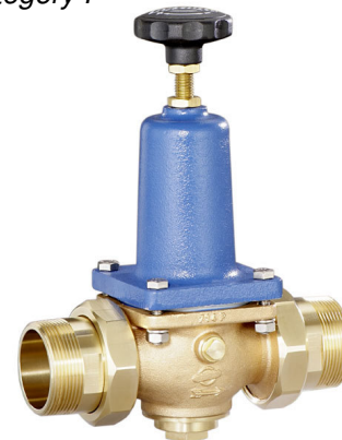
DN 40 - DN 65 (DRV 402-6)